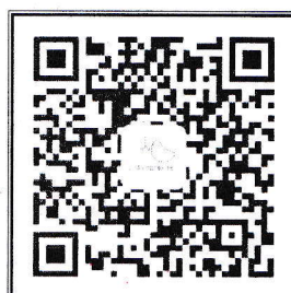
“中国肺功能联盟”微信公众号 微信号: fgnlm_cn

国家呼吸系统疾病临床医学研究中心 国家呼吸医学中心 中国医师协会呼吸医师分会肺功能与临床呼吸生理工作委员会