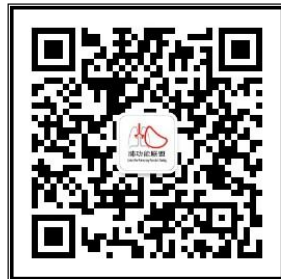
“中国肺功能联盟”微信公众号 微信号：fgnlm_cn

国家呼吸系统疾病临床医学研究中心 国家呼吸医学中心 中国医师协会呼吸医师分会肺功能与临床呼吸生理工作委员会 中国肺功能联盟 2023年10月04日