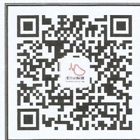
“中国肺功能联盟”微信公众号 微信号：fgnlm_cn

国家呼吸系统疾病临床医学研究中心 国家呼吸医学中心 中国医师协会呼吸医师分会肺功能与临床呼吸生理工作委员会 中国肺功能联盟 浙江大学医学院附属第二医院呼吸与危重症医学科 浙江省肺功能规范化培训浙大二院培训中心 2023年6月1日