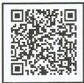
肺功能会议系统 在线查看会议及报名