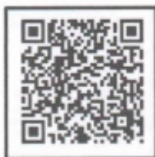
肺功能会议系统 在线查看会议及报名