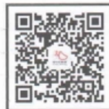
“中国肺功能联盟”微信公众号 微信号：fgnlm_cn