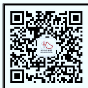
“中国肺功能联盟”微信公众号 微信号：fgnlm_cn

国家呼吸系统疾病临床医学研究中心 国家呼吸医学中心 中国医师协会呼吸医师分会肺功能与临床呼吸生理工作委员会