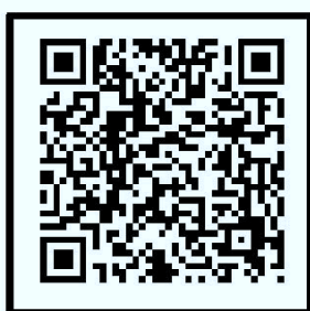
肺功能会议系统 在线查看会议及报名