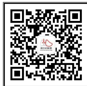
“中国肺功能联盟”微信公众号 微信号：fgnlm_cn

国家呼吸系统疾病临床医学研究中心 国家呼吸疾病医疗质量控制中心 中国医师协会呼吸医师分会肺功能与临床呼吸生理工作委员会 中国肺功能联盟 2022年8月14日