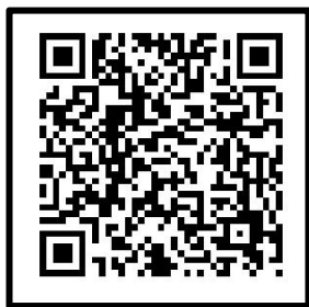
“扫一扫” 在线查看会议及报名