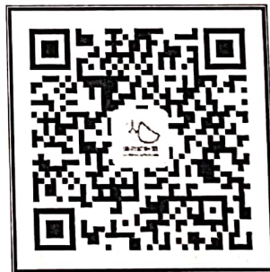
“中国肺功能联盟”微信公众号 微信号：fgnlm_cn