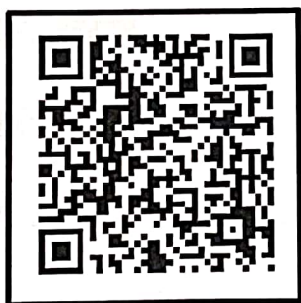
肺功能会议系统 在线查看会议及报名